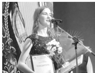
17 апреля прошёл XIV Городской творческий конкурс «Девушка Россия».

Это состязание помогает раскрыться талантливой молодёжи нашего города. При подготовке к конкурсным испытаниям девушки знакомятся с народными художественными промыслами, культурой и традициями.