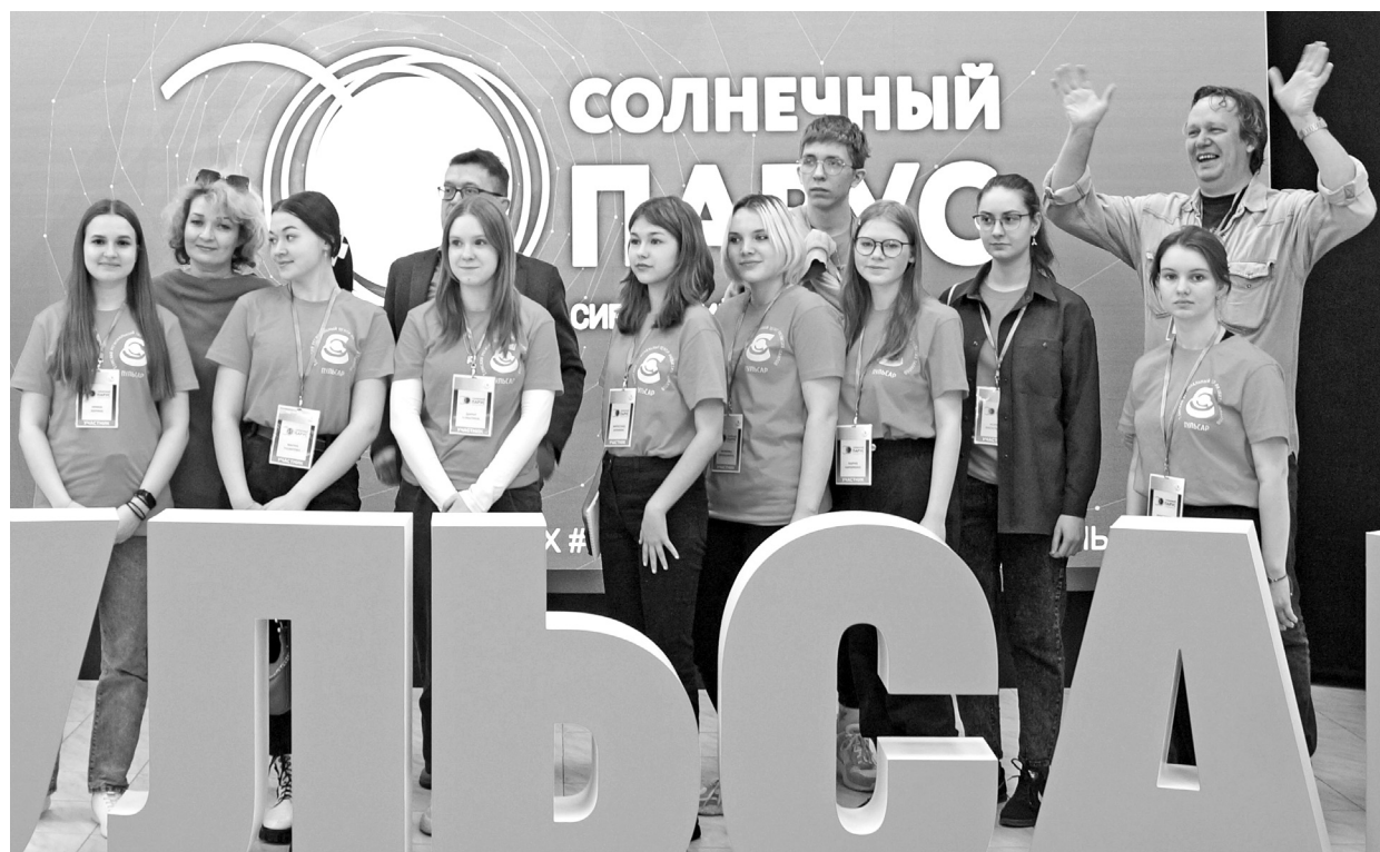
В Томске на базе регионального центра развития талантов «Пульсар» завершился фестиваль «Солнечный парус», участниками которого стали юные журналисты со всей России.

В 2024 году свои работы представили 276 школьников из 11 субъектов нашей страны. Они соревновались в таких конкурсах, как «Кинодетский метр», «Анимация», «ТВ-жанр», «Аудиоформат», «Хороший