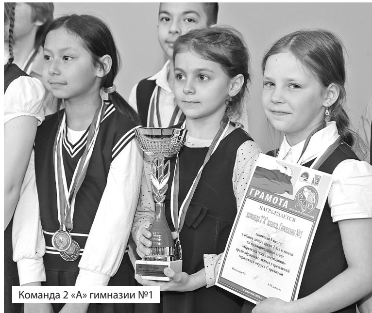
Команда 2 «А» гимназии №1

«Кубок пяти городов» продолжается. Впереди у нашей команды выездные игры в Пыть-Яхе, Излучинске, Покачах.