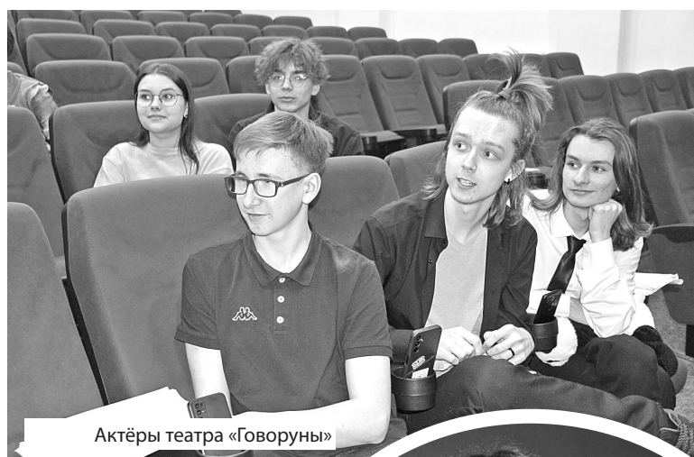
Актёры театра «Говоруны»